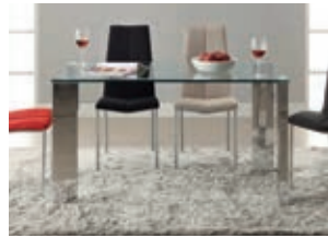
876873 /2071 pág. 28