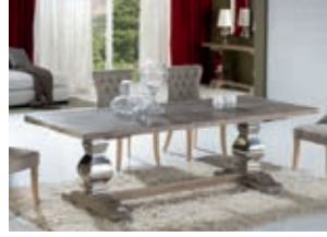
591684 pág. 4