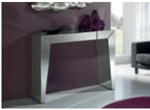
754861 pág. 34