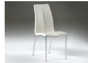
654248 pág. 51