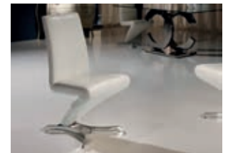
820972 pág. 48