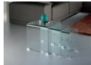
552283 pág. 39