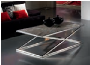
524075 pág. 9