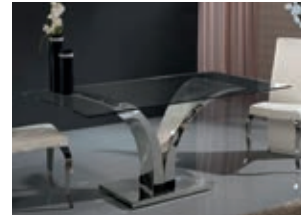
820613 /2112 pág. 16