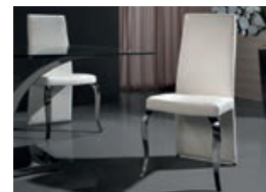
821146 pág. 49