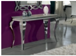
792386 /20721 pág. 11