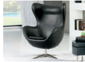
594719 pág. 55