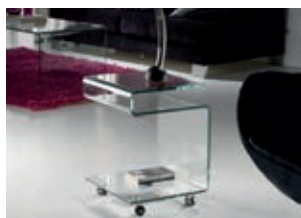
552522 pág. 38