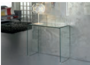
552431 pág. 36