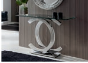
821437 pág. 22