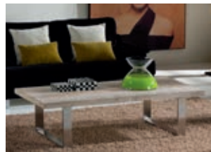
543690 pág. 8