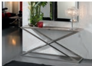
524123 pág. 10