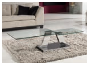
581238N pág. 40