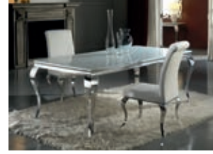
792107 /20691 pág. 12