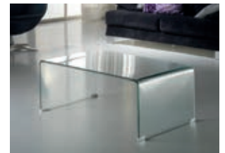
552307 pág. 37