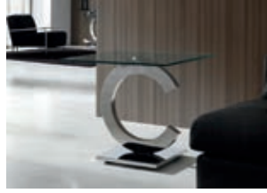
821629 pág. 20