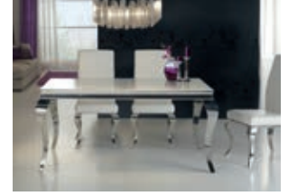
792219 /20701 pág. 14