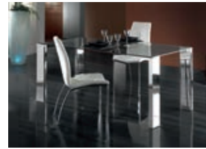
876873 /2082 pág. 26