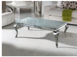
792425 /2073 pág. 15