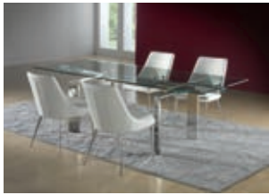
865397 pág. 31