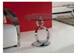
581451 pág. 42