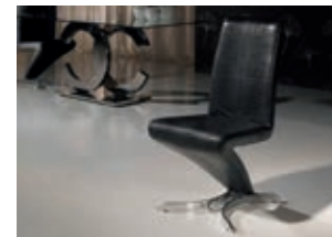
820941 pág. 48