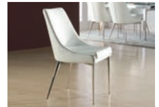
697146 pág. 52