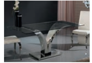
820613 /2113 pág. 16