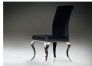
792572 pág. 46