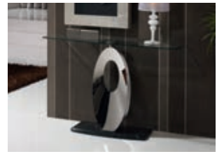
821268 pág. 35