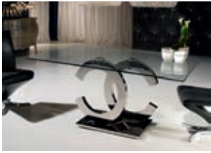
820426 /2059 pág. 18