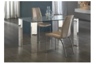
876873 /2084 pág. 28