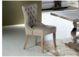
591826 pág. 45