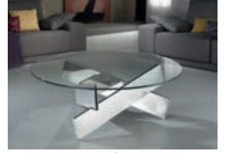
860752 /2083 pág. 43