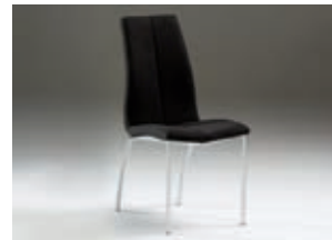
654235 pág. 50