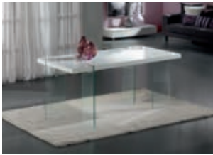
834862 pág. 24