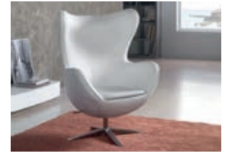
594782 pág. 54