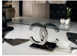
820426 /2060 pág. 18