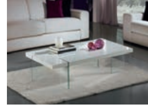
835149 pág. 23