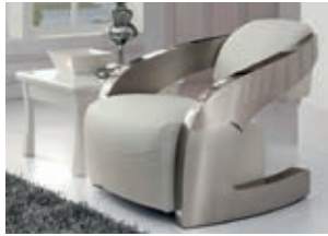
532115 pág. 53