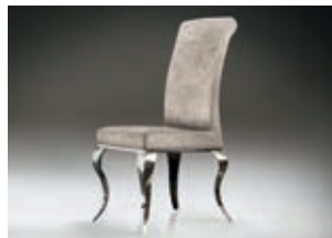
792549 pág. 46