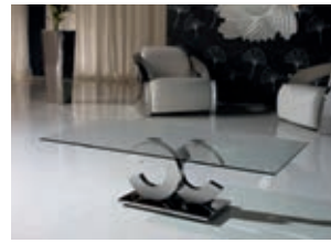
820318 pág. 21