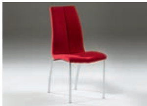
654213 pág. 50