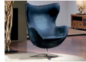
594723 pág. 56