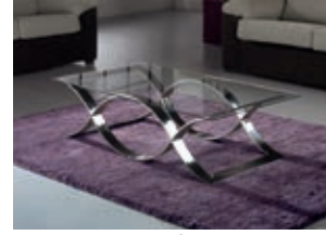
840842 /2061 pág. 41