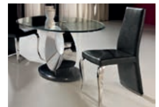
821177 pág. 49