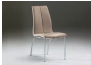
654227 pág. 51