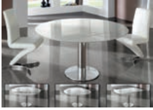
250516N pág. 32