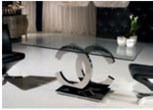
820426 /2059P pág. 18