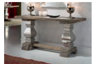
591762 pág. 3