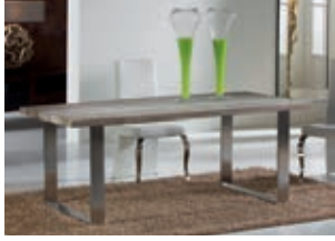
543519 pág. 6